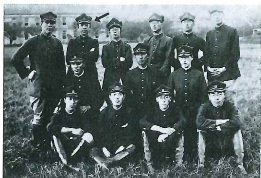
① 大正14年 東大馬術部にて