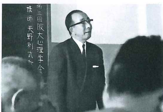
④ 阪大心理学会にて講演