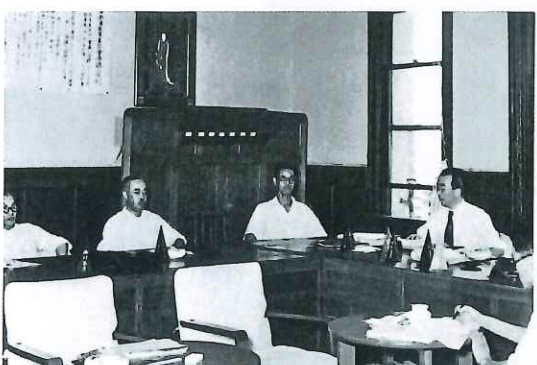
③ 昭和23年京都市教育長時代