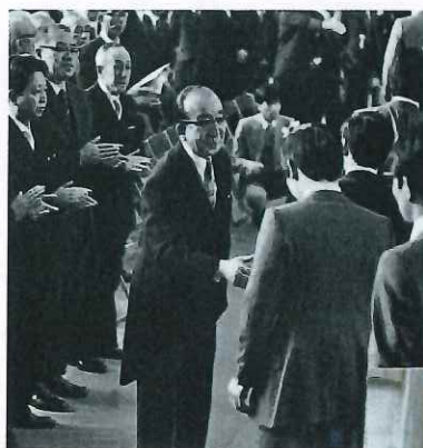
⑥ 毎年の大学卒業式にて 全員に握手をされる