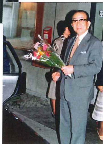
⑧ 昭和55年 退職時のお見送り