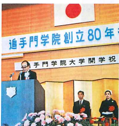
⑤ 昭和43年 学院創立80周年祝賀会式・ 大学開学式にて式辞